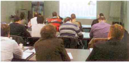
Die Besucher hörten viel Spannendes rund um die Short-Range-Funktechnik

Telion führte am 19. Januar das Seminar «Faszination Short-Range-Funktechnik» durch. Dabei referierten Vertreter der Firmen Radiocrafts sowie Smarteq über die folgenden Themen. Antennendesign: Range, Frequenzbänder und Ausgangsleistung sowie Abstrahlcharakteristiken verschiedener Antennentopologien, empfindlichere Antennen oder Signale verstärken. Lösungsvorschlag Funktechnik: Chips oder Module Ansatzpunkte. Protokolle: MBUS, KNX, ZigBee. Auf grosses Interesse stiessen bei den Besuchern Anwendungsbeispiele anhand von Fallstudien aus der Praxis. www.telion.ch