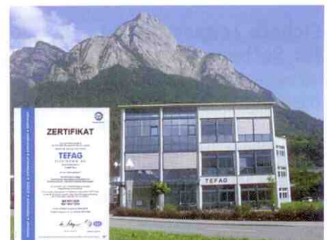
Tefag bestätigt seine langjährige Erfahrung und Kompetenz im OEM-Business nun auch offiziell

In 2010 konnte Rutronik eigenen Angaben zufolge europaweit den höchsten Umsatz mit Komponenten von Samsung Electro-Mechanics erzielen. Mit den Keramik- und